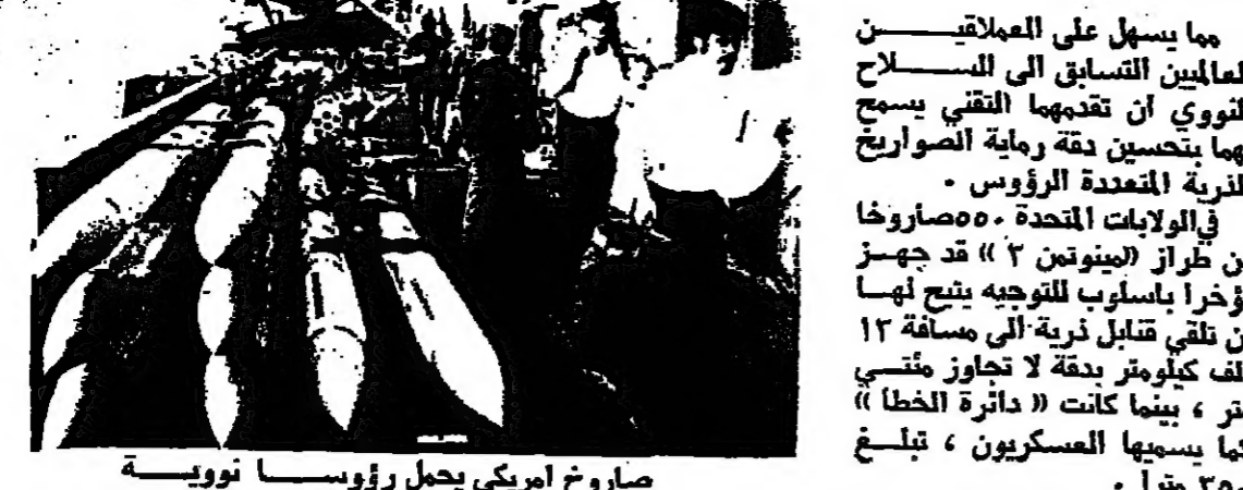
صاروخ امريكي يحمل رؤوسا نووية